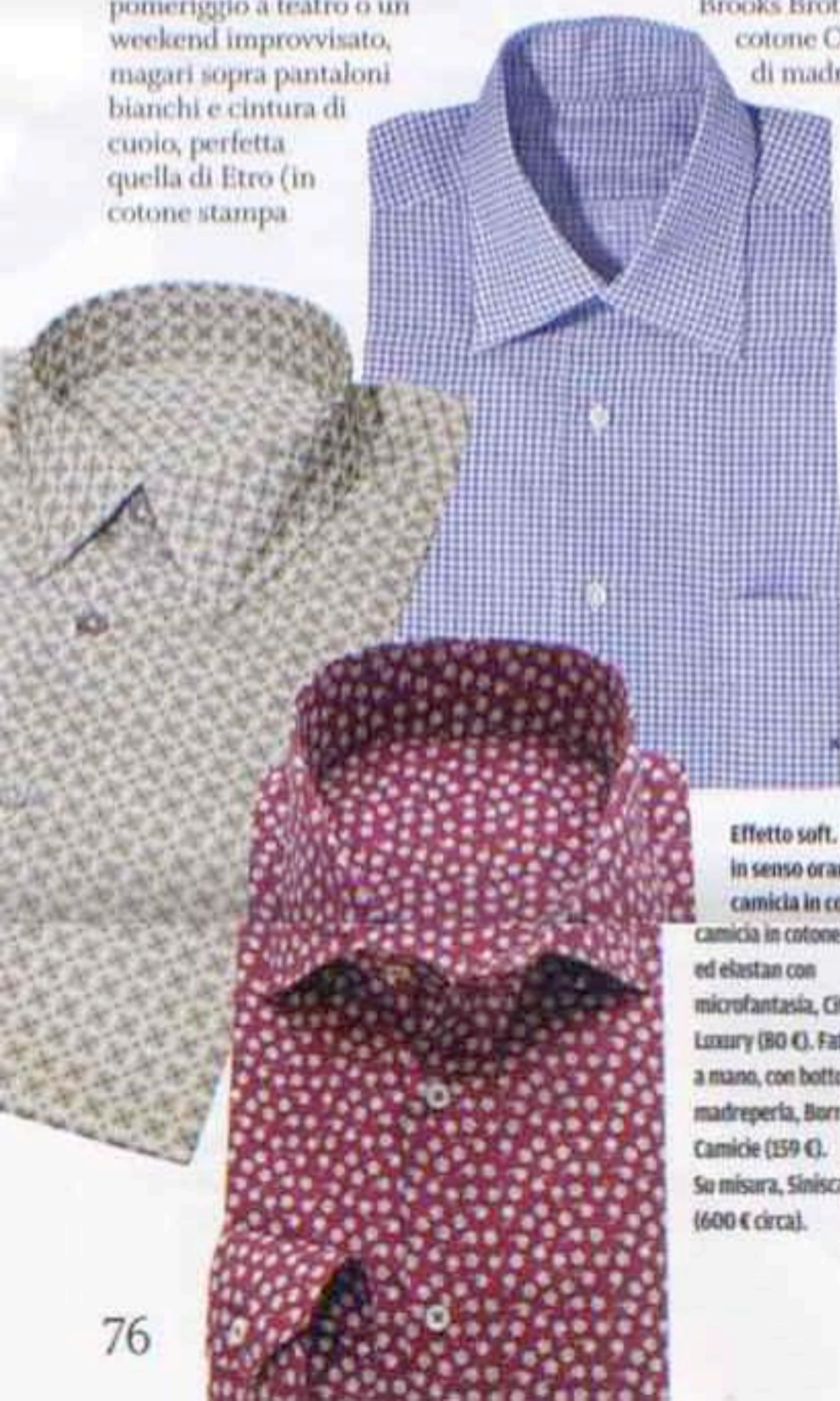
Effetto soft. Dal basso, in senso orario: camicia in cotone

camicia in cotone ed elastan con microfantasia, Cit Luxury (80 €). Fatta a mano, con bottoni in madreperla, Borriello Camicie (159 €). Su misura, Siniscalchi (600 € circa).