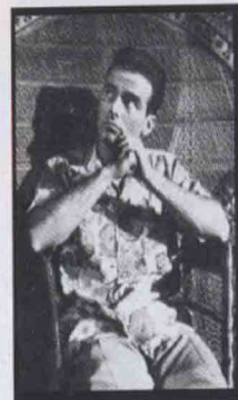
1. Luchino Visconti sul set del film Il Gattopardo . 2. Fred Astaire in camicia fantasia. 3. Marlon Brando in un ritratto degli anni Cinquanta. 4. Montgomery Clift sul set di Da qui all'eternità .